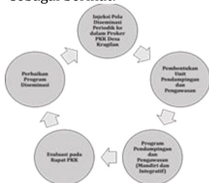
Gambar 2: Role Pola Diseminasi Periodik Pemenuhan Hak Anak di dalam keluarga Pada Lingkungan Desa Kragilan.

Role dari pola deseminasi periodik pemenuhan hak anak di dalam keluarga pada lingkungan Desa Kragilan dapat divisualisasikan dalam diagram alir sebagai berikut: