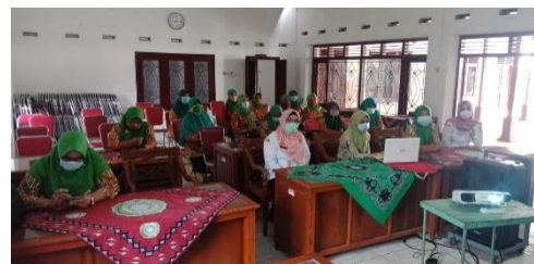
Gambar 1: Penyuluhan atau sosialisasi hak anak di dalam keluarga dan masyarakat

realisasi, maka perlu dimasukkan ke Program Kerja Pemberdayaan Kesejahteraan Keluarga (PKK) Desa Kragilan. Dengan demikian, pola kegiatan diseminasi terhadap pemenuhan hak anak di dalam keluarga pada lingkungan Desa Kragilan dapat dilakukan secara periodik sebagai fungsi kontrol dan tolok ukur keberhasilan. Pelaksanaan Rapat Program Kerja Pemberdayaan Kesejahteraan Keluarga (PKK) Desa Kragilan dapat menjadi sarana temporer untuk mengukur implementasi dari pola diseminasi periodik pemenuhan hak anak di dalam keluarga. Dengan demikian, dapat dipahami bahwa langkah pertama adalah memasukkan pola diseminasi periodik pemenuhan hak anak di dalam keluarga ke dalam Program Kerja Pemberdayaan Kesejahteraan Keluarga (PKK) Desa Kragilan dan selanjutnya memposisikan Rapat Program Kerja Pemberdayaan Kesejahteraan Keluarga (PKK) Desa Kragilan yang dilakukan setiap satu bulan sekali sebagai media evaluasi pemenuhan target-target pola diseminasi periodik tersebut. Dalam evaluasi dapat menyertakan parameter keterpenuhan hak anak, khususnya sebagaimana diatur di dalam peraturan perundang-undangan maupun konvensi internasional. (Halvorsen 1990, p. 341).