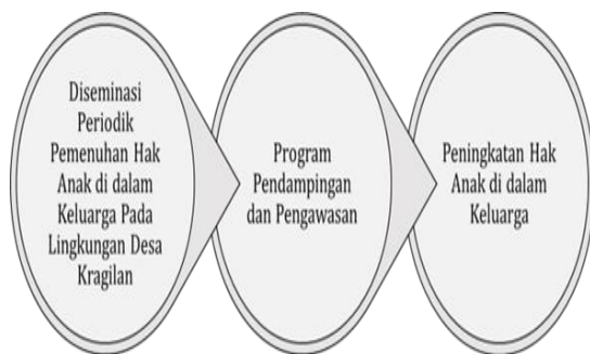
Gambar 1: Alur dan Sasaran Diseminasi Periodik Pemenuhan Hak Anak di dalam Keluarga Pada Lingkungan Desa Kragilan.

Metode dan proses dapat digambarkan dalam alur sebagai berikut: